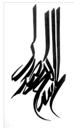
▲ نصرآ... افجه‌ای - رنگ و روغن روی بوم