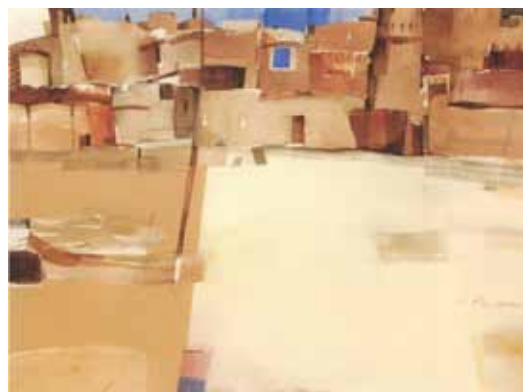
▲ شهلا احمدی‌مقدم - ترکیب مواد روی کاغذ