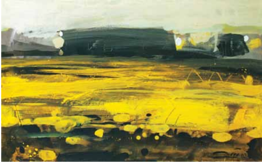
▲ احمد وکیلی - اکریلیک روی بوم